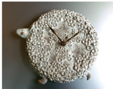
陶レリーフ時計 φ約160mm