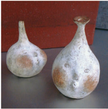
「壺人シリーズ」右側の作品 h. 約80mm