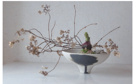
「予感」花器：半磁器 花材：ヤマアジサイ、ヒヤシンス

山岸きよみ Kiyomi Yamagishi 長野市松代町生まれ。ギフトウェアのデザイナーを経て、1987年ニューヨークに移り住む。パーソンズ・スクール・オブ・デザインにてメタルデザインを学び、創作活動に入る。金属や天然石も、自分と同じ「自然の一部」と捉え、その命の流れ=自然の息吹をアートジュエリーに再現。2014年、スタジオを松代に移す。