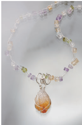
beyond the ages 時をこえて S.Silver, Citrine, Amethyst, Aquamarine, Peridot