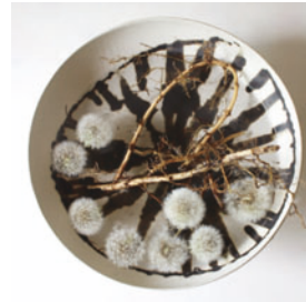
「永遠」花器：半磁器 花材：たんぽぽの綿毛、熊笹の根